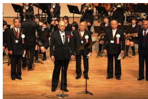
本校吹奏楽部と同窓会有志の記念演奏