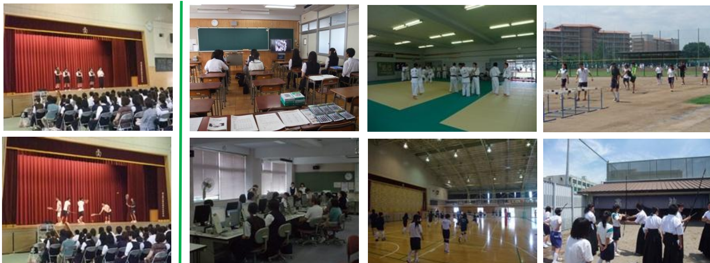
部活動紹介の様子

8月3日(土)、本年度第1回目となる学校説明会と部活動体験を開催しました。第1部は学校概要や入試選抜基準、各部活動の紹介。第2部では校内見学と部活動体験を行いました。当日は600名弱の皆様にご来校いただきました。本当にありがとうございました。次回は9月28日(土)に「熱いぞ熊商！体験授業」を開催いたします。