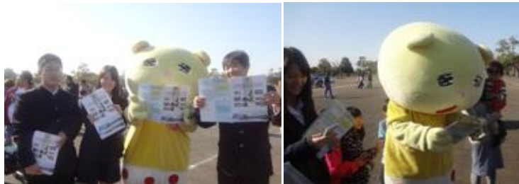
左写真：ニャオざね君とまなびや履修生との記念ショット！！ 右写真：熊商の学校案内を真剣な眼差しで読むニャオざね君

11月23日（土）と24日（日）の2日間、熊谷スポーツ文化公園にて第9回熊谷市産業祭が行われました。まなびやを履修している生徒が参加し、熊商@まなびやの紹介や会場内で熊商の学校案内などの配布を行いました。