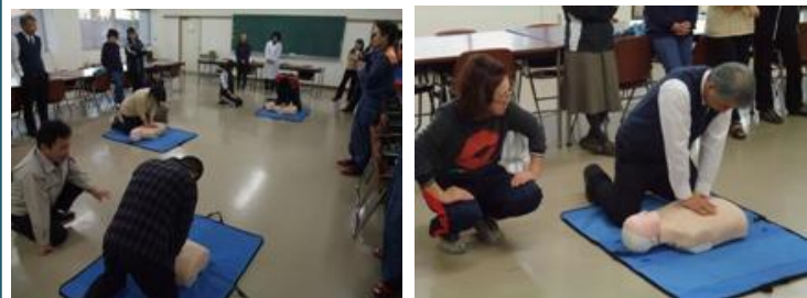
講習会の様子 学校長も講習会に参加！

11月20日（水）、教職員を対象に救急法講習会を行いました。熊谷市消防本部・熊谷消防署の隊員の方を講師にお招きし、心臓マッサージや AED の使用方法についてレクチャーを受けました。