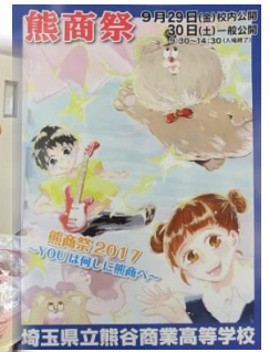
埼玉県立熊谷商業高等学校